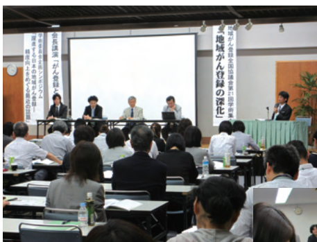
▲シンポジウムのようす

末筆ながら、集会の滞りない運営にご協力いただいた参加者の皆様に改めて感謝申し上げるとともに、来年度の秋田県での第22回学術集会のご盛会をお祈り申し上げます。