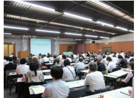
▲会場は満員の大盛況でした

学術集会当日は梅雨空が恨めしい生憎の天気でしたが、朝早くから多くの方にお集まりいただきました。今回から新しく、学術委員会が継続性のあるテーマのもとに主催することとなったシンポジウムでは、近年著しく届出精度向上が改善した県から、具体的な工夫や取り組みをご報告いただきました。他の県が、短期間で届出精度向上を実現することに役立つシンポジウムになりました。