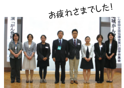
▲第21回学術集会スタッフのみなさん