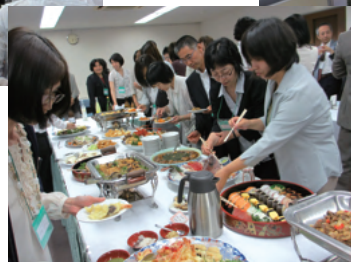
▲土佐の「皿針(さわち)料理」に舌鼓…。