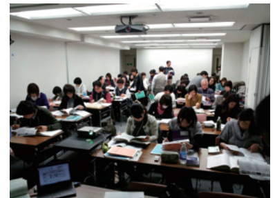
コーディング演習の様子▲

がん登録を担う実務者の育成と行政担当者への情報提供は、がん対策情報センターのミッションです。今年度も、12月7日～8日の日程で地域がん登録行政担当者・実務者講習会を開催し、105名の参加が